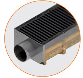
Topo com descarga