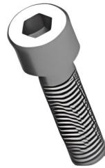
Kit de ancoragem